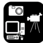
Media en digitale wereld

Je kan keuze aanbieden op verschillende domeinen: keuze in hoe lang kinderen spelen, met wie ze spelen, waarmee ze spelen en waar.