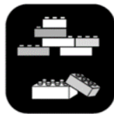
Bouwen en techniek