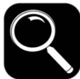
Onderzoeken en ontdekken