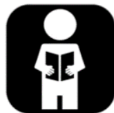
Voorlezen, vertellen en filosoferen