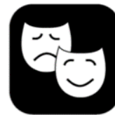
Uitbeelden, drama en fantasiespel