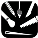
Tekenen, boetseren, knutselen en schilderen